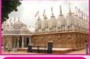
શ્રી શંખેશ્વર તીર્થ